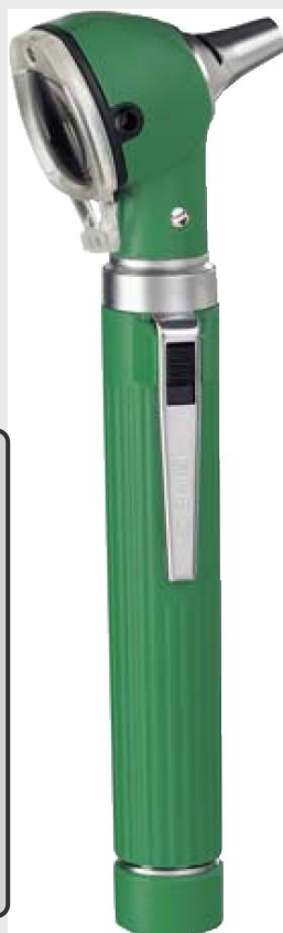
HEINE MINI 2000® Ф.О.