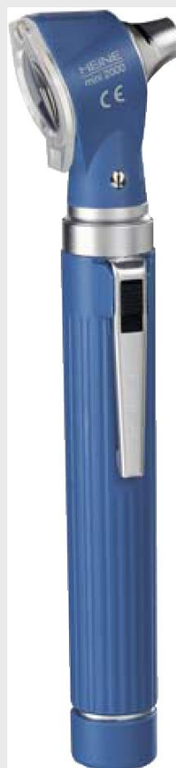
Отоскоп HEINE ALPHA+ Прямое ХНЛ

✓ Лампы HEINE всегда можно приобрести у нас со склада и под заказ!!!