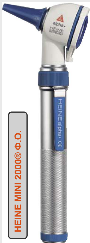
HEINE MINI 2000® Ф.О.

ИСТОРИЯ О ТОМ, ЧТО СНЯТО УЖЕ С ПРОИЗВОДСТВА HEINE, ДАННЫЕ ВЗЯТЫ ИЗ КАТАЛОГА 2005 ГОДА!