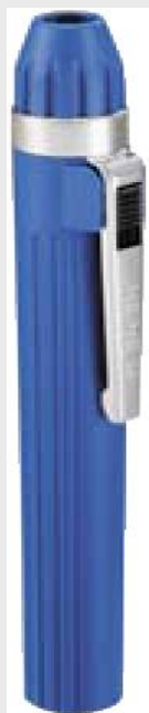
ОСВЕТТЕЛЬ HEINE MINI 1000® CLIPLAMP

ИСТОРИЯ О ТОМ, ЧТО СНЯТО УЖЕ С ПРОИЗВОДСТВА HEINE, ДАННЫЕ ВЗЯТЫ ИЗ КАТАЛОГА 2005ГОДА!