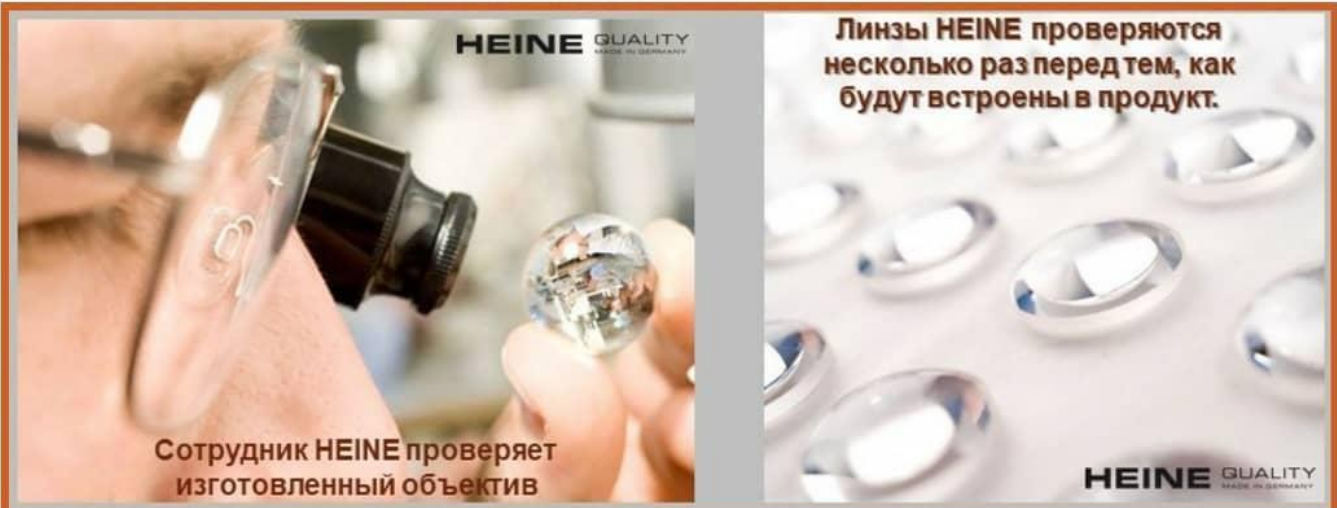
Сотрудник HEINE проверяет изготовленный объектив