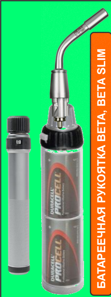
БАТАРЕЙНАЯ РУКОЯТКА БЕТА, БЕТА SLIM