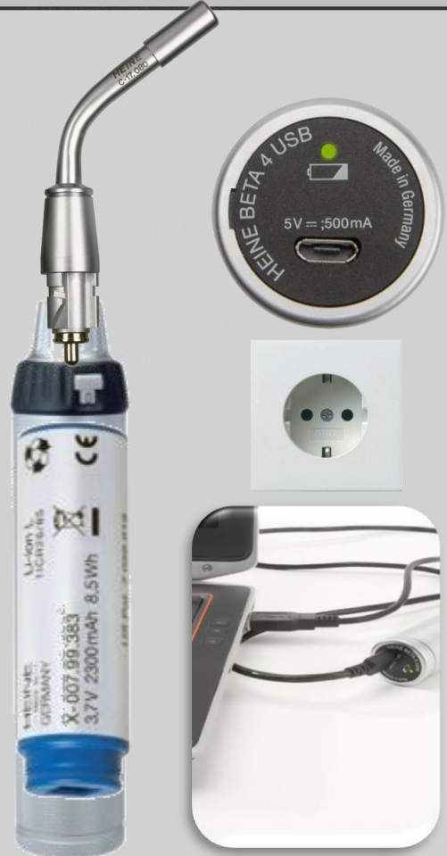
ПЕРЕЗАРЯЖАЕМАЯ РУКОЯТКА БЕТА 4 USB