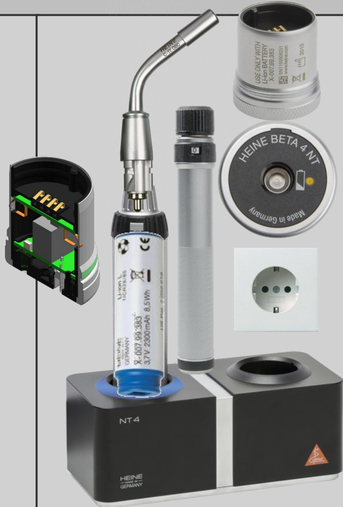
ПЕРЕЗАРЯЖАЕМАЯ РУКОЯТКА БЕТА 4 NT