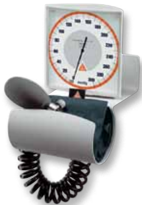
[ 01 ]