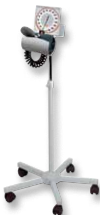
[ 02 ]