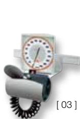
[ 03 ]